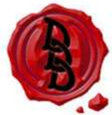
Spiele-Offensive.de kooperiert mit DDD Verlag.

Happyshops ist ein moderner und technologieorientierter Onlineversandhandel, hauptsächlich für Spielwaren. Er führt zahlreiche Onlineshops wie unter anderem www.Spiele-Offensive.de , www.Puzzle-Offensive.de oder www.Perfekte-Bilderrahmen.de . Jeder Shop ist auf ein Produktsegment spezialisiert und ermöglicht so fachkundige Beratung und Inspiration. Das Angebot richtet sich an Privatkunden Weitere Informationen unter www.happyshops.com .