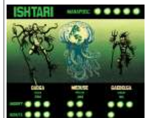
Völkertableau der Ishtari.