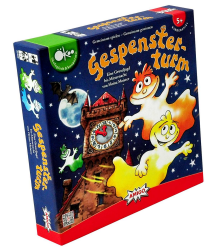
Leelawadee (Prototyp)

Happyshops ist ein moderner und technologieorientierter Onlineversandhandel, hauptsächlich für Spielwaren. Er führt zahlreiche Onlineshops wie unter anderem www.Spiele-Offensive.de , www.Puzzle-Offensive.de oder www.Perfekte-Bilderrahmen.de . Jeder Shop ist auf ein Produktsegment spezialisiert und ermöglicht so fachkundige Beratung und Inspiration. Das Angebot richtet sich an Privatkunden Weitere Informationen unter www.happyshops.com .