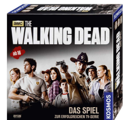
The Walking Dead