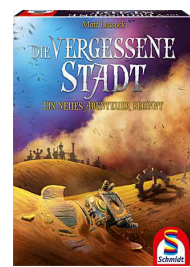
Die vergessene Stadt.