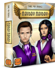
Vorläufiges Packshot Mayday!Mayday!

Happyshops ist ein moderner und technologieorientierter Onlineversandhandel, hauptsächlich für Spielwaren. Er führt zahlreiche Onlineshops wie unter anderem www.Spiele-Offensive.de , www.Puzzle-Offensive.de oder www.Perfekte-Bilderrahmen.de . Jeder Shop ist auf ein Produktsegment spezialisiert und ermöglicht so fachkundige Beratung und Inspiration. Das Angebot richtet sich an Privatkunden Weitere Informationen unter www.happyshops.com .