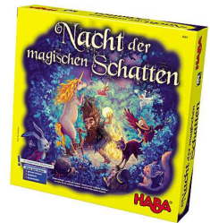
Nacht der mag. Schatten.

Happyshops ist ein moderner und technologieorientierter Onlineversandhandel, hauptsächlich für Spielwaren. Er führt zahlreiche Onlineshops wie unter anderem www.Spiele-Offensive.de , www.Puzzle-Offensive.de oder www.Perfekte-Bilderrahmen.de . Jeder Shop ist auf ein Produktsegment spezialisiert und ermöglicht so fachkundige Beratung und Inspiration. Das Angebot richtet sich an Privatkunden Weitere Informationen unter www.happyshops.com .