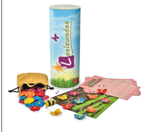
Leelawadee (Prototyp)

Ansprechpartnerin: Claudia Liehr (Pressesprecherin)