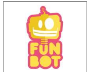
Logo des Verlags