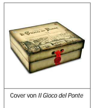
Cover von Il Gioco del Ponte

Happyshops ist ein moderner und technologieorientierter Onlineversandhandel, hauptsächlich für Spielwaren. Er führt zahlreiche Onlineshops wie unter anderem www.Spiele-Offensive.de , www.Puzzle-Offensive.de oder www.Perfekte-Bilderrahmen.de . Jeder Shop ist auf ein Produktsegment spezialisiert und ermöglicht so fachkundige Beratung und Inspiration. Das Angebot richtet sich an Privatkunden. Weitere Informationen unter www.happyshops.com .