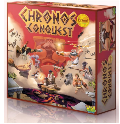
Cover von Chronos Conquest

Happyshops ist ein moderner und technologieorientierter Onlineversandhandel, hauptsächlich für Spielwaren. Er führt zahlreiche Onlineshops wie unter anderem www.Spiele-Offensive.de, www.Puzzle-Offensive.de oder www.Perfekte-Bilderrahmen.de. Jeder Shop ist auf ein Produktsegment spezialisiert und ermöglicht so fachkundige Beratung und Inspiration. Das Angebot richtet sich an Privatkunden. Weitere Informationen unter www.happyshops.com.