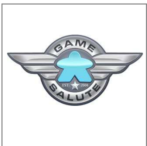
Logo von Game Salute