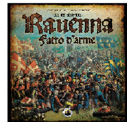
Cover Ravenna, Fatto d'Arme