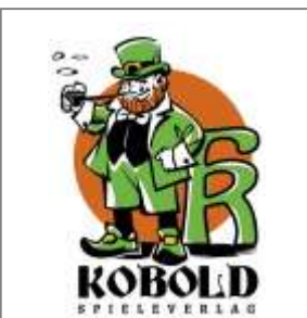
Logo des Verlags