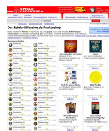
Punkteshop des Spielernetzwerks