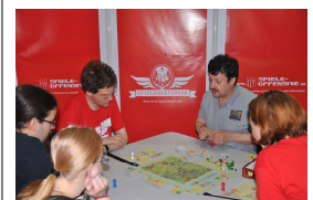
Spielernetzwerker beim Prototypentest