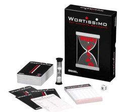
Wortissimo