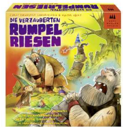
D. verzaub.Rumpelries.

Happyshops ist ein moderner und technologieorientierter Onlineversandhandel, hauptsächlich für Spielwaren. Er führt zahlreiche Onlineshops wie unter anderem www.Spiele-Offensive.de , www.Puzzle-Offensive.de oder www.Perfekte-Bilderrahmen.de . Jeder Shop ist auf ein Produktsegment spezialisiert und ermöglicht so fachkundige Beratung und Inspiration. Das Angebot richtet sich an Privatkunden. Weitere Informationen unter www.happyshops.com .