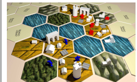
Spielszene Romolo o Remo