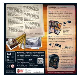
Rückseite, (c) Spieltrieb GbR., Illustr.: C. Opperer