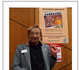
Autor Till Meyer ruft zum Bankraub auf

Bildmaterial finden Sie unter folgendem Link: www.happyshops.com/downloads/bankraub.zip