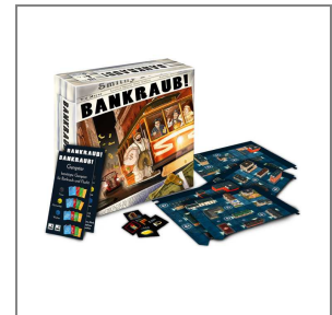
Spielmaterial (c) Spieltrieb GbR., Illustr.: C. Opperer

Happyshops ist ein moderner und technologieorientierter Onlineversandhandel, hauptsächlich für Spielwaren. Er führt zahlreiche Onlineshops wie unter anderem www.Spiele-Offensive.de , www.Puzzle-Offensive.de oder www.Perfekte-Bilderrahmen.de . Jeder Shop ist auf ein Produktsegment spezialisiert und ermöglicht so fachkundige Beratung und Inspiration. Das Angebot richtet sich an Privatkunden. Weitere Informationen unter www.happyshops.com .