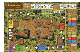
Spielplan von Lignum