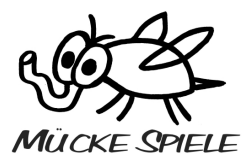
Mücke Spiele Logo