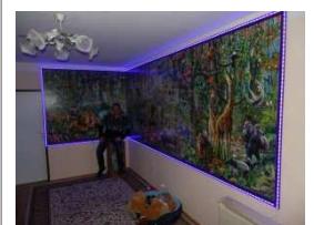
Fertig aufgehängt in seiner Wohnung

Ansprechpartnerin: Claudia Liehr (Pressesprecherin)