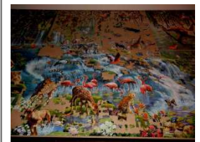
Simetsberger puzzelte nach Strategie