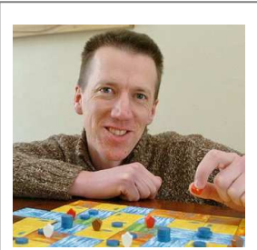
Martyn F, Autor von Oklahoma Boomers

Happyshops ist ein moderner und technologieorientierter Onlineversandhandel, hauptsächlich für Spielwaren. Er führt zahlreiche Onlineshops wie unter anderem www.Spiele-Offensive.de mit seiner Crowdfunding-Plattform der Spieleschmiede.