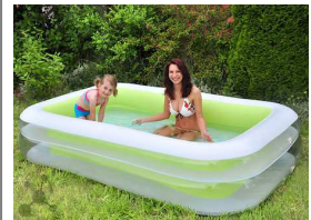
Der Verkaufs-Schlager: der Family Pool